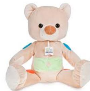
“Lino e il diabete: storia di un amico coraggioso” e il peluche di “Lino” (AGD Italia, 2022).